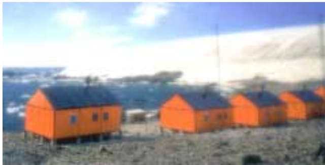
Base Antártica «Esperanza» -sector antártico argentino-